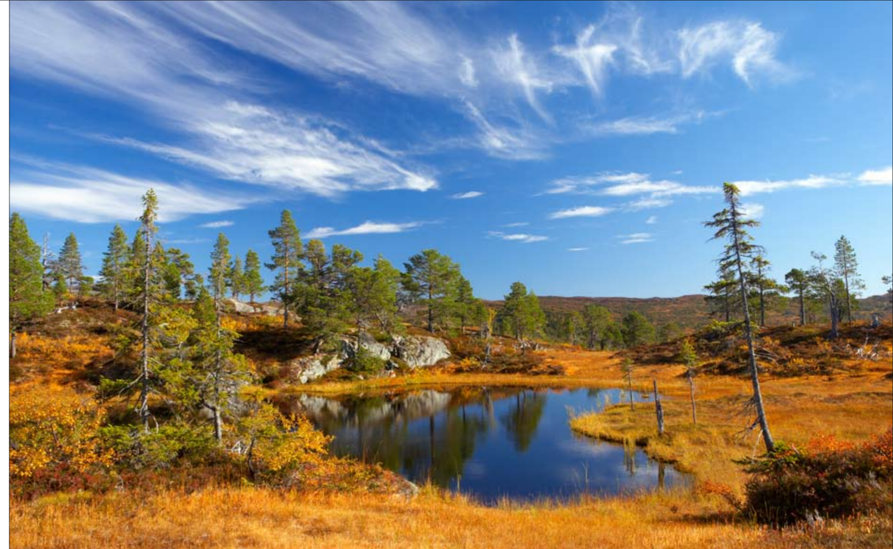
Blå himmel, gullfargede myrer og blinkende blankt vann møter den som besøker meråkerfjella en høstlig godværstdag.